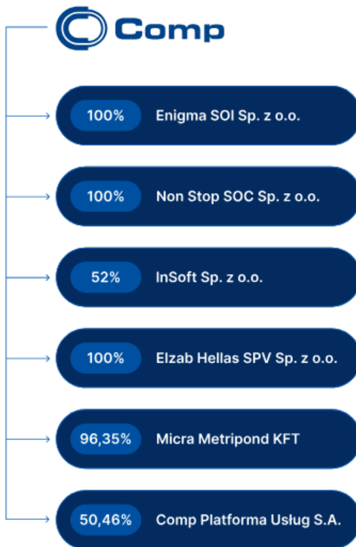
Rysunek 1. Struktura Grupy Kapitałowej Comp S.A.

Comp S.A. jako jednostka dominująca Grupy Kapitałowej Comp, sprawuje nadzór właścicielski nad pozostałymi spółkami należącymi do Grupy oraz wypracowała formułę dialogu pomiędzy nimi, zgodnie z obowiązującymi regulacjami prawnymi.